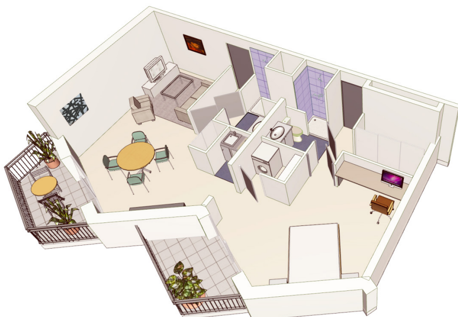
Vue 3D de 2 appartements reliés

Les logements de la résidence sont tous sécurisés et meublés mais il vous est aussi possible d'emménager avec vos meubles et objets personnels.