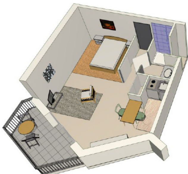
Vue 3D appartement Type 1 standard (2 lits de 90 ou 1 lit de 180) - 32m 2

Tous les appartements disposent d'un balcon ou d'une terrasse