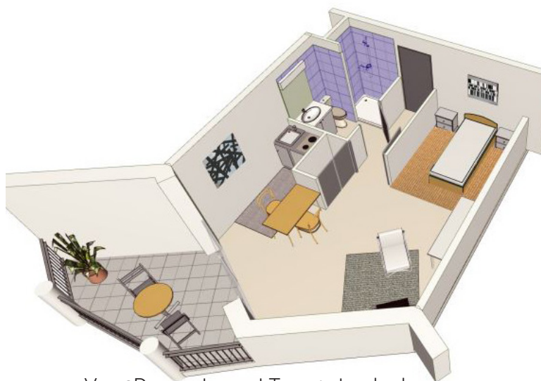
Vue 3D appartement Type 1 standard (1 lit de 90) - 29m 2

Consultez les photos de la résidence sur www.residence-agera.com